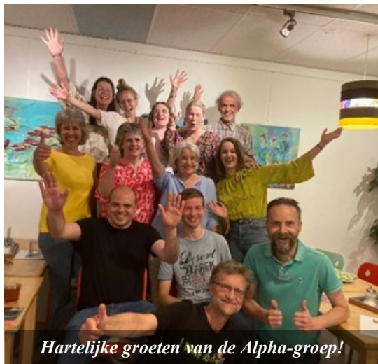
Hartelijke groeten van de Alpha-groep!