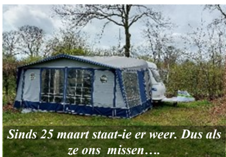
Sinds 25 maart staat-ie er weer. Dus als ze ons missen....