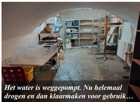
Het water is weggepompt. Nu helemaal drogen en dan klaarmaken voor gebruik...

Hoe blijf je staande in deze tijd? Waar moet je het zoeken, of bij wie? We spreken veel mensen die zich machteloos en zwak voelen. Dan is het goed om te weten én te zien dat wij een machtige en krachtige God hebben. En wij ontvangen zijn kracht om over Hem te getuigen. In Deventer, in Nederland en in de hele wereld.